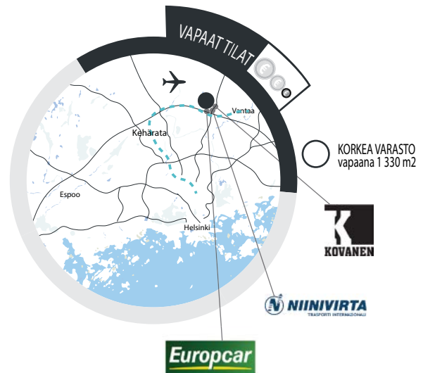
Robert Huberintie 7

Vapaaseen tilaan pääsee ajamaan kätevästi suoraan nosto-ovesta ja avoimeen varastotilaan saadaan helposti myös rakennettua pieni toimistotila tarvittaessa. Kiinteistön piha tarjoaa runsaasti parkkipaikkoja niin työntekijöille kuin vierailijoille.