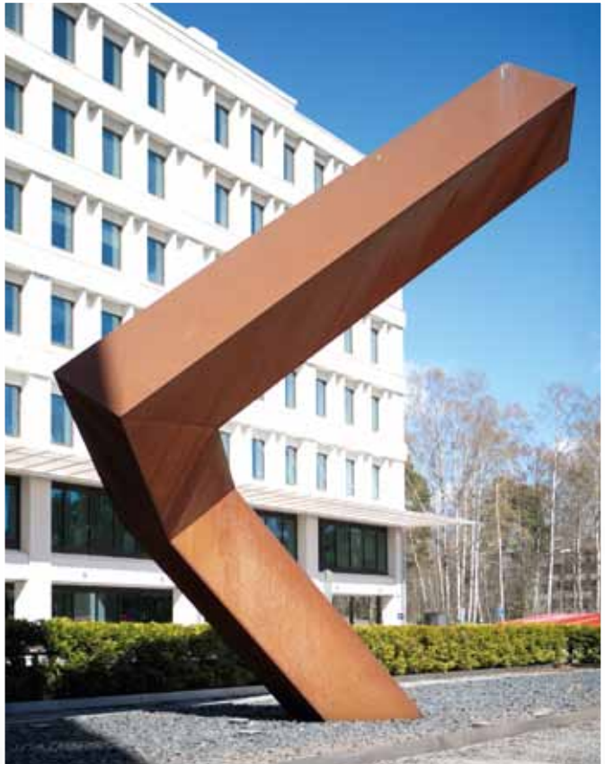
Julkisivun aukkofasadi on tunnistettavaa tapiolalaista tyyliä.